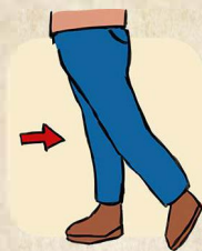
5. EIN SCHRITT ZURÜCK