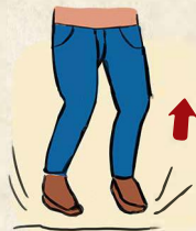
6. HOPSER AUF DER STELLE