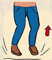
2. HOPSER AUF DER STELLE