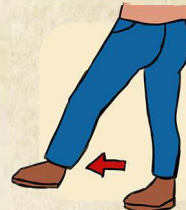
3. EIN SCHRITT NACH VORN