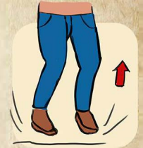
4. HOPSER AUF DER STELLE