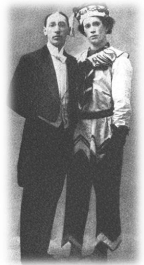
Igor Stravinsky und Vaslav Nijinsky (1911)

So lässt sich die Handlung von Igor Strawinskys Ballett Petruschka kurz zusammenfassen. In diesem Werk mischt sich das ganz reale Leben auf dem Jahrmarkt mit dem Spiel der Marionetten, wobei aus dem anfänglichen Puppentheater schließlich eine wirkliche Tragödie wird. Den Jahrmarkt schildert Strawinsky durch Anklänge an russische Volkstänze sehr anschaulich. Die Grenzen zwischen Realität und Fiktion verwischen jedoch, wenn aus den Puppen richtige Menschen zu werden scheinen.