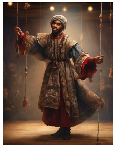
Erstellt mit Dreamstudio by Stability AI

Er ist stark und beeindruckend, aber auch etwas grob. Die Ballerina verliebt sich in ihn.