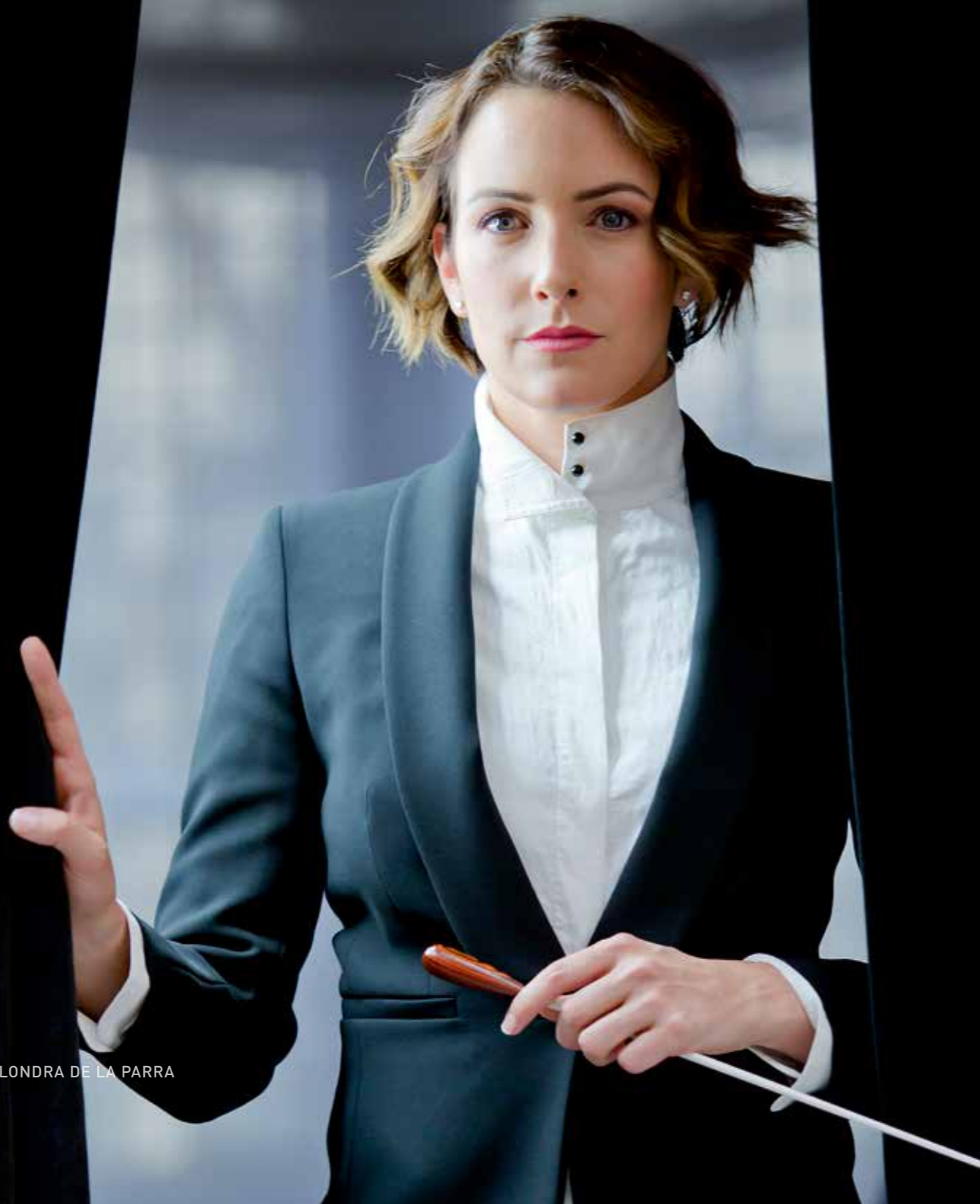
ALONDRA DE LA PARRA