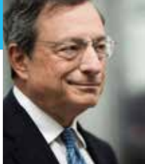
MARIO DRAGHI Präsident, Europäische Zentralbank President, European Central Bank