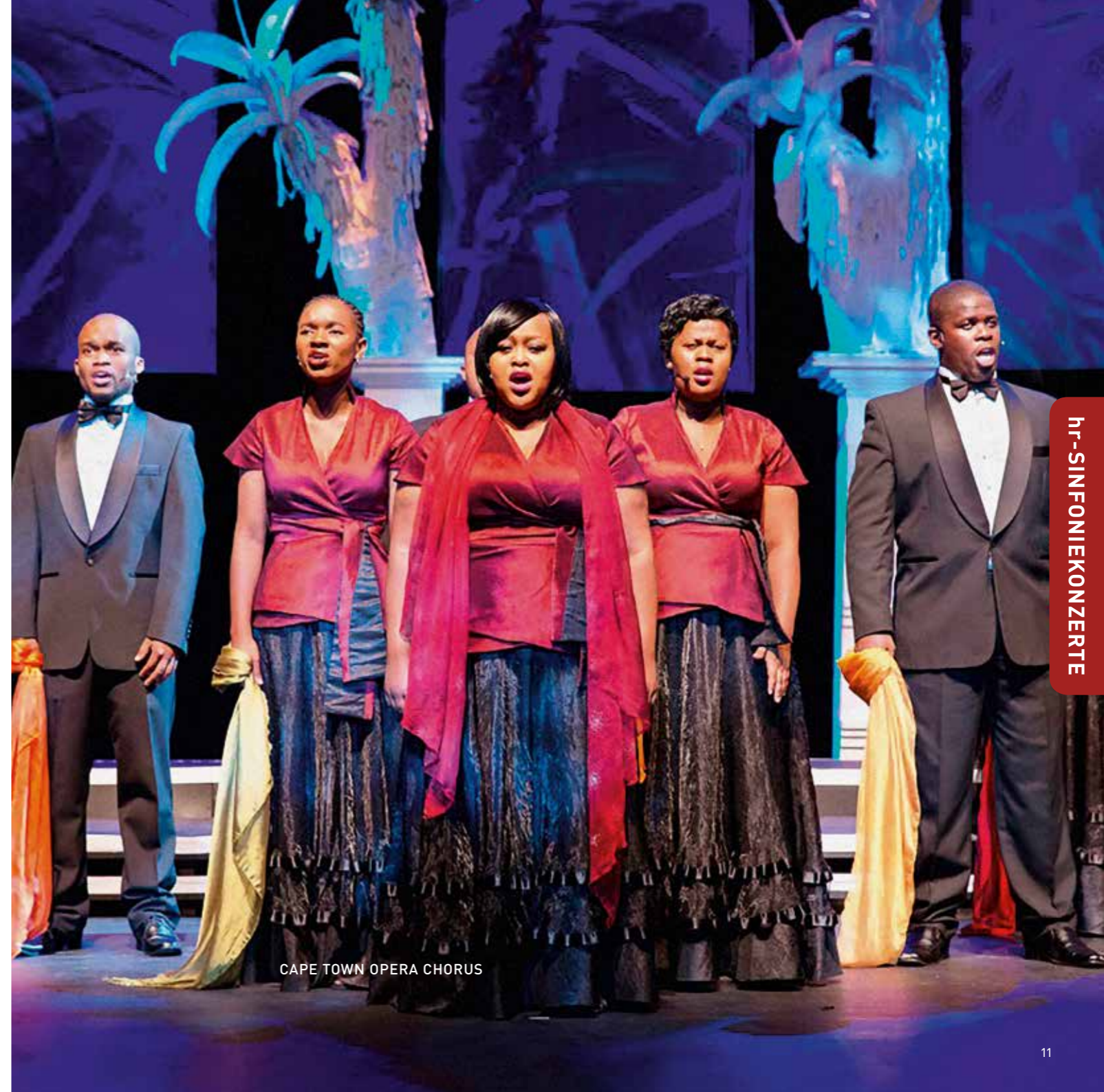
CAPE TOWN OPERA CHORUS

Karten: 54,50 € | 44,50 € | 35,50 € | 26,- € | 17,- €. Bis zu 50 % Ermäßigung – Infos: Seite 108 hr-Ticketcenter: (069) 155-2000 | Abo-Service: (069) 155-4111