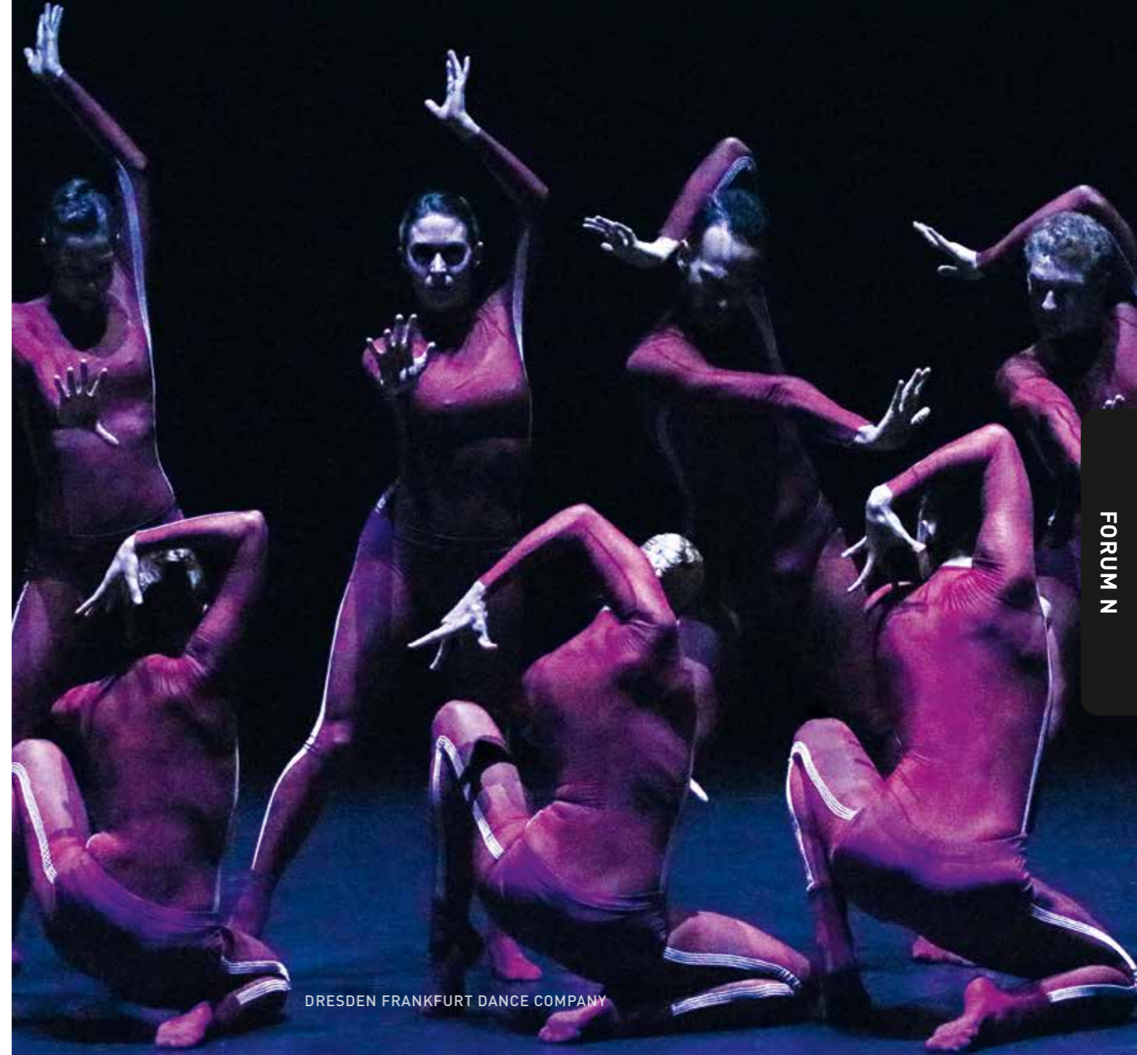
DRESDEN FRANKFURT DANCE COMPANY

Karten: 36,- €. Bis zu 50 % Ermäßigung – Infos: Seite 108 hr-Ticketcenter: (069) 155-2000 | Abo-Service: (069) 155-4111